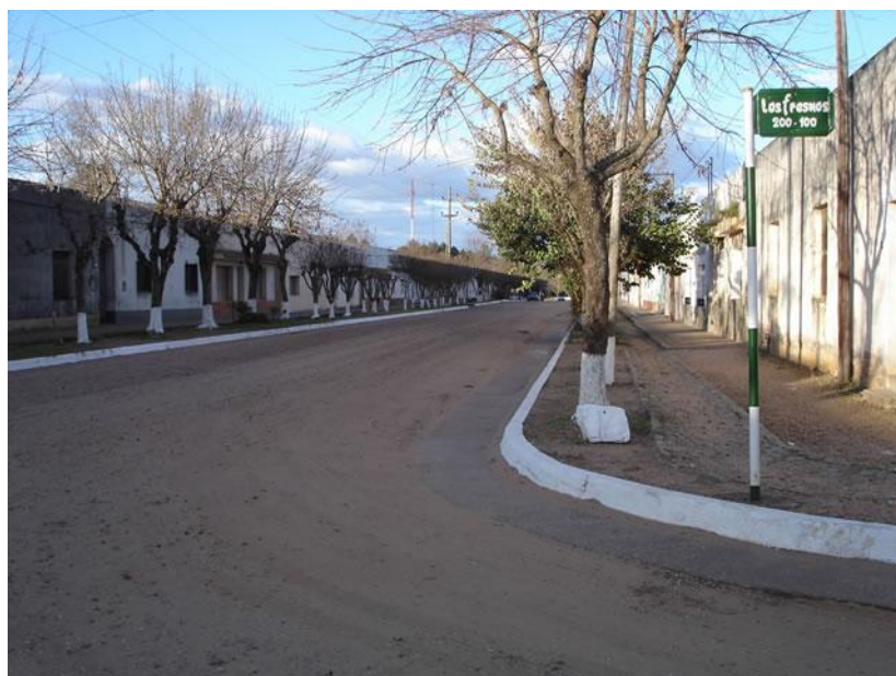
Calle céntrica del pueblo a cuyos costados se levantaban las viviendas de los obreros casados. En otros sectores del pueblo se erigían las viviendas para solteros.

En 1970 la fábrica cerraría por un año, abriendo nuevamente bajo la firma FRICOSA. Finalmente sería vendida a la firma Vizental, que alimentaría a 2.500 familias, luego a menos de 100, hasta que sus importantes instalaciones acabaran desmanteladas y vendidas. Liebig , estructurada desde sus orígenes en torno al frigorífico , pasaría a depender de su atractivo como producto turístico, erigiéndose incluso frente a la plaza un monumento a la lata de corned beef como símbolo del pueblo.”