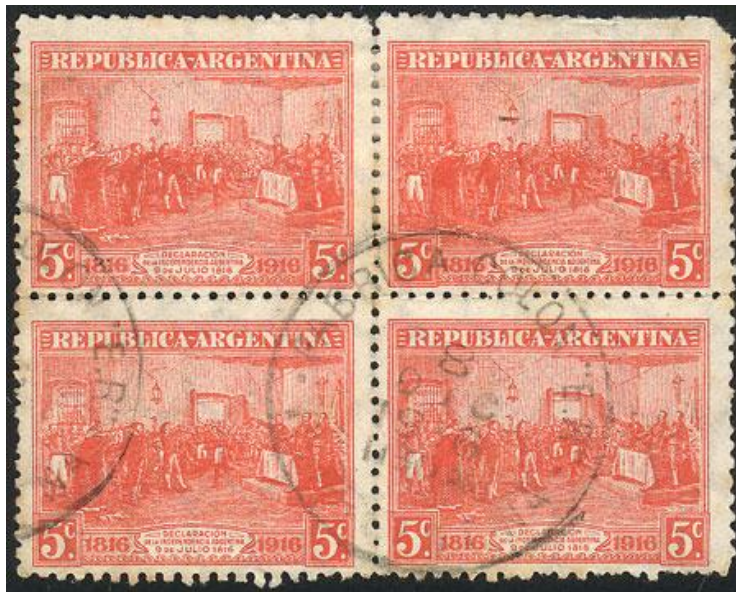
MT 201, 5c. del Centenario de la Independencia