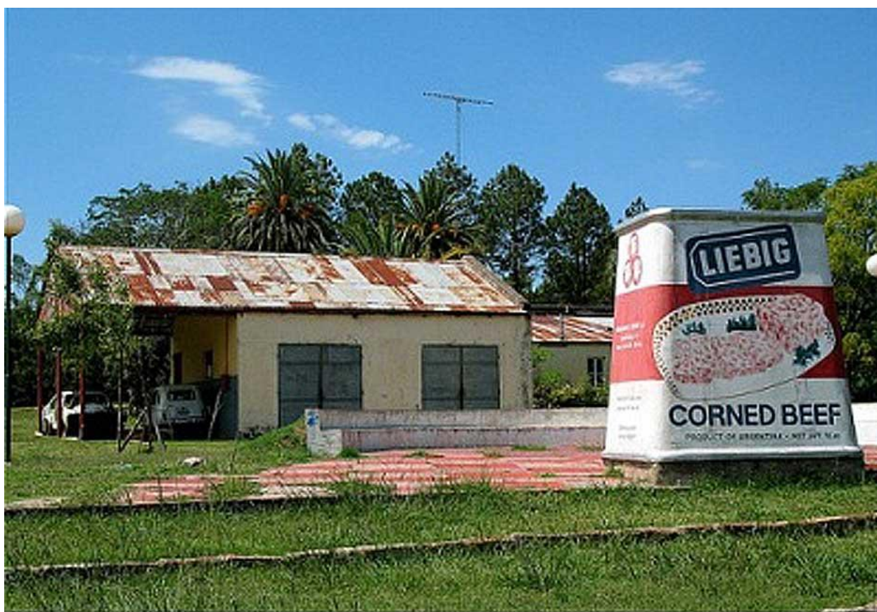
En el centro del Pueblo el monumento al producto del frigorífico