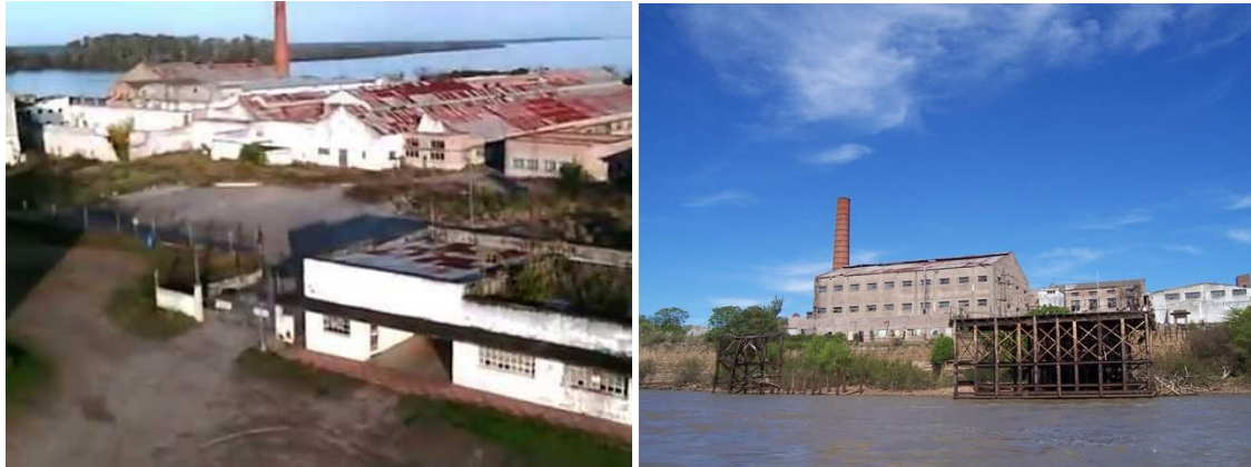
Vista de las instalaciones hoy abandonadas Desde el Rio Uruguay, el muelle de embarque

El momento de mayor auge comercial y económico para la empresa se daría en tiempos de la Segunda Guerra Mundial, debido a la gran demanda de alimentos existente en los países centrales, y a la producción local de carne en conserva que se embarcaba a Gran Bretaña directamente desde el puerto instalado sobre el río Uruguay . Pero acabado el conflicto bélico, las modificaciones de la legislación de la Unión Europea, los cambios tecnológicos y los nuevos gustos del mercado impulsarían la decadencia del producto.